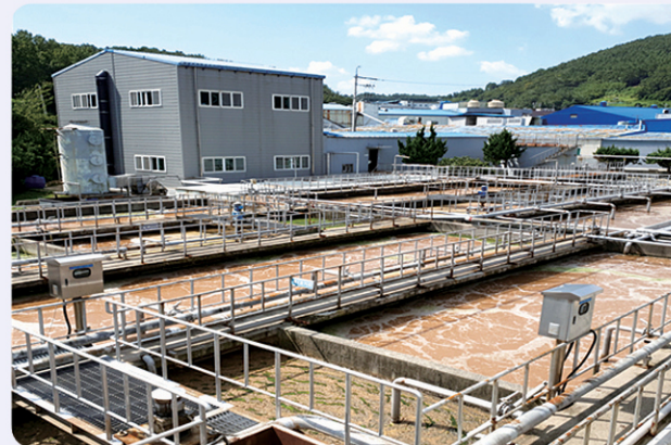
사진 : 여수오천산업단지식품가공사업협동조합 공동폐수처리장